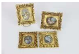
Lot n°157 École du XXe siècle dans le goût du XVIIIe siècle,...