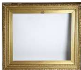
Lot n°164 - 1 Grand cadre en bois et stuc doré. Dimensions...