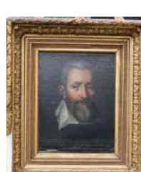
Lot n°153 École française du XVIe. Portrait de Jean...