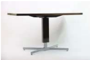
Lot n°300 Florence KNOLL (1917-2019). (Dans le goût). Table à...