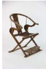
Lot n°433 CHINE, XXème Circa 1920. Chaise pliante de Mandarin...