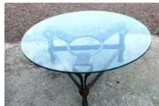
Lot n°306 Jacques ADNET (1900-1984). Table Basse en Fer Forgé...