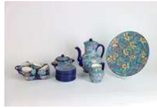
Lot n°141 EMAUX DE LONGWY. Partie de service à café en émaux...