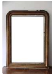
Lot n°203 Grande glace en stuc doré époque de la fin du...