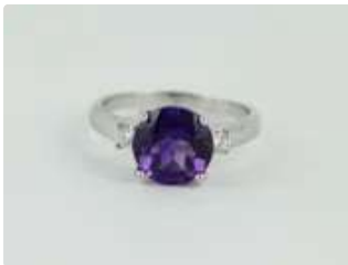
Lot n°48 Bague en or gris 18K (750/1000) centrée d'une...