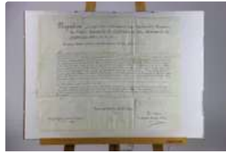
Lot n°199 Manuscrit. Napoléon Ier : Pièce signée secrétaire....