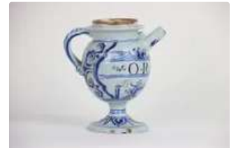
Lot n°130 NEVERS. Chevrette en faïence à décor en camaïeu bleu...