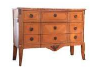
Lot n°183 Commode à ressaut en placage de bois, ouvrant par...