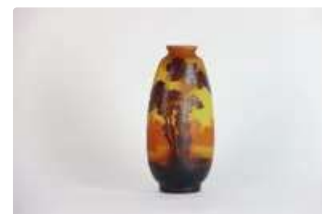
Lot n°233 Émile GALLE (1846 - 1904). Vase en verre à fond...