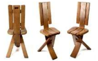
Lot n°291 Pierre CHAPO (1927-1987). (Dans le goût de). Suite... Est. : 400 - 600 €