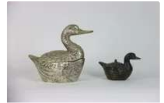
Lot n°323 Mauro MANETTI (né en 1946). Seau à glaçons en métal...