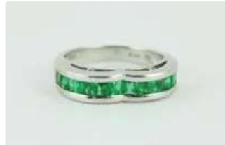
Lot n°41 Bague en or gris 18K (750/1000) pavé d'une ligne...