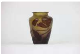
Lot n°227 Émile GALLÉ (1846 - 1904). Vase en verre à décor...