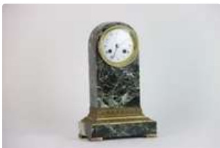
Lot n°218 Garniture de cheminée en marbre vert comprenant une...