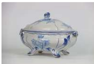
Lot n°234 GALLÉ NANCY & Saint-Clément. Soupière en faïence à...