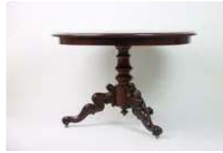
Lot n°213 Guéridon à pieds tripode en bois mouluré et sculpté...