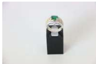
Lot n°37 Bague en or jaune et blanc à trois rangs de...