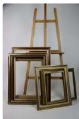
Lot n°222 Réunion de neuf cadres en bois doré, XXe siècle....