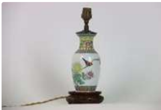
Lot n°436 - 2 CHINE. Petit vase en porcelaine à décor d'oiseaux...