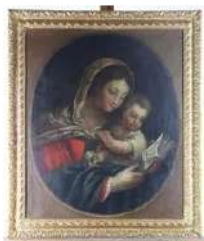
Lot n°151 École française de la fin du XVIIIe siècle. Vierge...