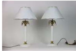
Lot n°370 Lampe à poser en céramique et bronze, à décor de...