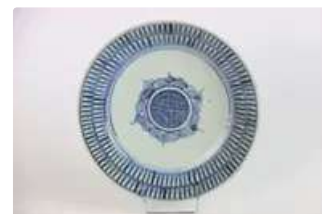
Lot n°432 - 5 Vietnam fin XIXe siècle. Coupe creuse en porcelaine...