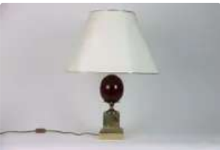
Lot n°372 Maison CHARLES. Lampe de table style Ananas...