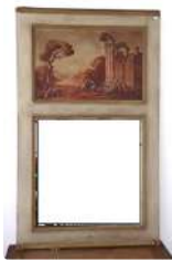
Lot n°202 Trumeau en bois peint à décor d'une vue de ruines...