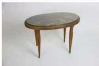
Lot n°231 Émile GALLÉ (1846-1904) Table de salon de forme...