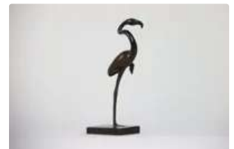
Lot n°113 Roy SHELDON (XXème siècle) : Flamand rose la patte...