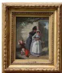
Lot n°168 École du XIXème. " L'enfant de Metz ". Huile sur...