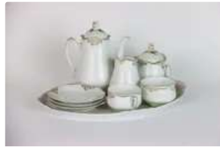
Lot n°144 HERMANN OHME. Partie de service à café en porcelaine...