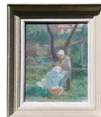
Lot n°237 MAJORELLE Louis (Toul, 1859-1926, Nancy). "La...