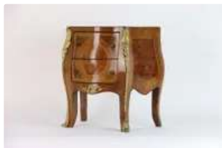
Lot n°175 Commode de maîtrise Louis XV, garniture en bronze...