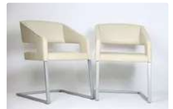
Lot n°379 Paire de fauteuils Conforto Collection B-Sit Modèle...