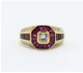
Lot n°40 Bague en or jaune 18K (750/1000) centrée d'un...