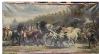
Lot n°423 Rosa Bonheur (1822-1899), (dans le gout). Le marché... Est. : 800 - 1 200 €