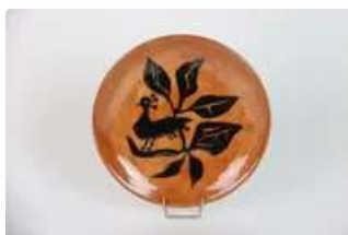
Lot n°313 - 2 Jean Lurçat (1892-1966). Assiette en céramique à...