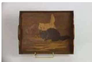
Lot n°230 - 1 Emile GALLE (1846-1904). Plateau à deux anses...