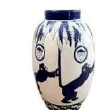
Lot n°249 Vase de style Art Déco en céramique craquelée à...