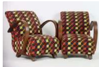
Lot n°326 Paire de Fauteuils Type C, Jindřich Halabala pour Up...