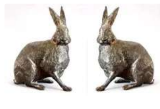
Lot n°98 Pierre Chenet (XXe siècle). Paire de lièvres aux...