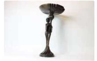
Lot n°267 - 2 Jeune femme en robe longue soutenant une large...