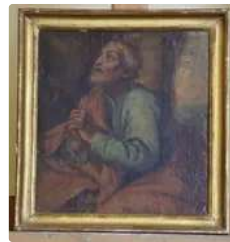
Lot n°149 École dans le goût du XVIIe siècle, La prière de...