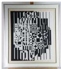
Lot n°385 Victor VASARELY (1906-1997), Composition,...