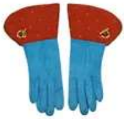
Lot n°25 - 1 HERMES. Paire de gants en cuir turquoise avec...