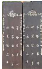
Lot n°437 Indochine vers 1920, travail de Nam Dinh. Deux...