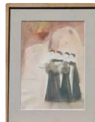
Lot n°391 Dora Maar, de son vrai nom Henriette Théodora...