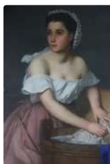
Lot n°166 Thomas COUTURE (1815-1879). La lavandière. Pastel...