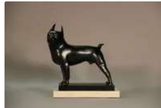
Lot n°106 François POMPON (1855-1933). (D'après). Sculpture en...