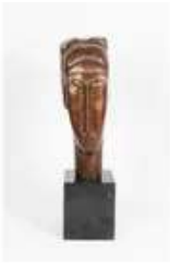
Lot n°127 Amadeo MODIGLIANI (1884-1920). (d'après). Tête de...