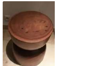
Lot n°357 Olivier De SCHRIJVER (né en 1958). École Belge. Une...