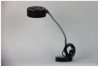
Lot n°296 Charlotte Perriand (1903-1999). (Dans le goût de)....