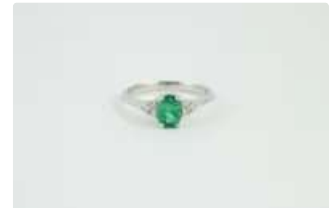
Lot n°47 Bague en or gris 18K (750/1000) centrée d'une...