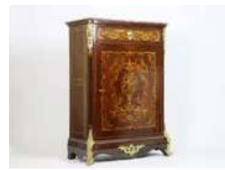
Lot n°222 - 2 Époque Napoléon III. Confiturier en acajou et...