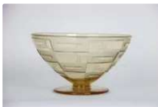
Lot n°246 DAUM Nancy. Coupe ronde en verre transparent gravé...