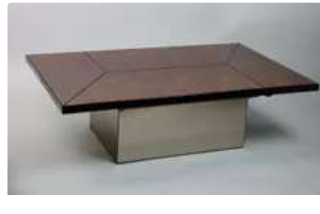
Lot n°336 - 1 MAISON ROMEO. Table basse en placage de bois de...