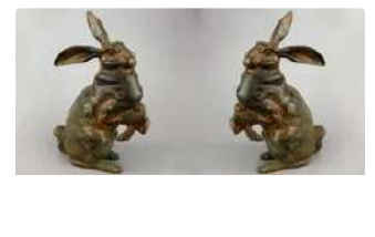
Lot n°99 Pierre Chenet (XXe siècle). Paire de lièvres en...