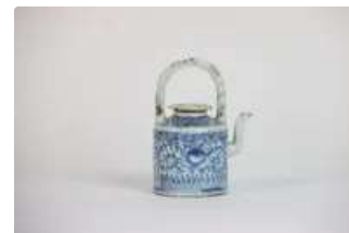
Lot n°432 - 1 Chine, fin XIXe début XXe siècle, Petite théière...