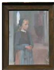
Lot n°236 MAJORELLE Louis (Toul, 1859-1926, Nancy). " Portrait...