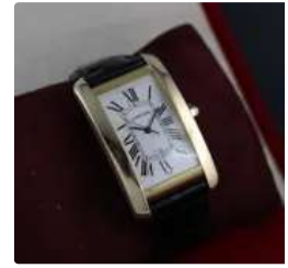
Lot n°71 CARTIER Tank Américaine réf. 1740 Montre bracelet...