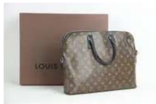
Lot n°66 Louis VUITTON. Sacoche homme en cuir monogramme....