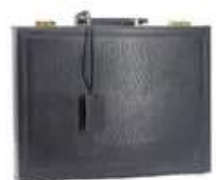
Lot n°67 - 1 VAN CLEEF & ARPELS. Attaché case en varan noir,...