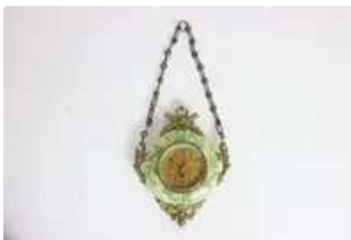
Lot n°208 - 2 Pendule Boulangère, le corps en faïence de...