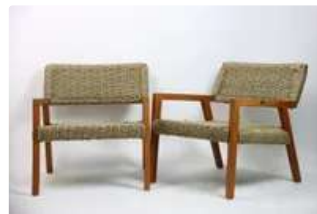
Lot n°362 Olivier De SCHRIJVER (né en 1958). École Belge. Deux...