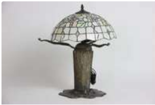
Lot n°267 - 3 Louis Comfort TIFFANY (1848-1933) dans le goût,...