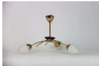
Lot n°373 Édition ARLUS - PARIS FRANCE: Lustre à trois bras de...