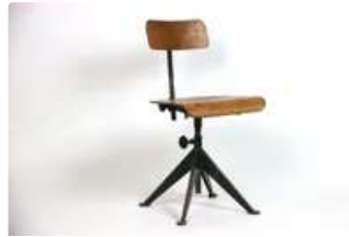
Lot n°318 Jean PROUVE (1901-1984). Chaise à dossier et fût...