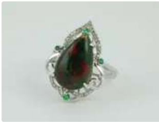
Lot n°44 Bague en or gris 18K (750/1000) orné d'une opale en...