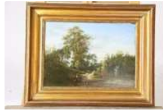
Lot n°412 - 2 Ecole française du XIXe siècle, Le chemin de... Est. : 200 - 300 €