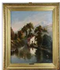
Lot n°167 Pierre-Victorien LOTTIN, dit LOTTIN DE LAVAL...