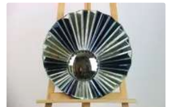
Lot n°363 Olivier De SCHRIJVER (né en 1958). École Belge. Un...