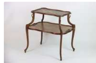
Lot n°230 Emile GALLE (1846-1904). Grande table à thé à deux...