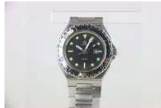
Lot n°74 ZENITH. Montre pour homme a quartz. Bracelet Acier.