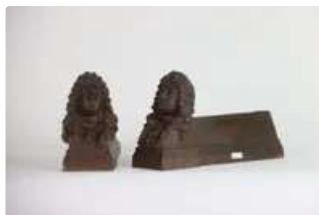
Lot n°179 Paire de chenets en bronze, à l'effigie de Stanislas...