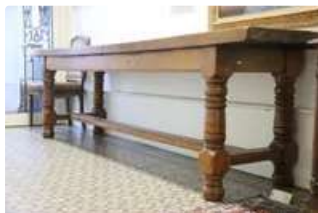
Lot n°174 Grande table rectangulaire dite "de monastère" en...