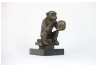
Lot n°96 Sculpture en bronze sur socle en marbre." Le Singe...