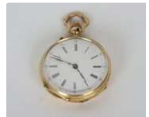
Lot n°83 Montre de gousset en Or 18K (750°/°). Les heures en...