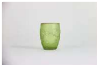
Lot n°225 DAUM Nancy. Vase miniature en vert jaune à décor de...