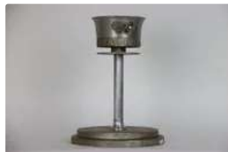
Lot n°274 Torche officielle en alliage d'aluminium des Jeux de...