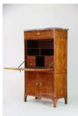
Lot n°181 Secrétaire en bois marqueté ouvrant par un abattant...