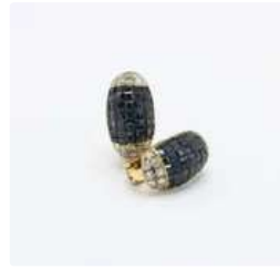
Lot n°57 Paire de boucles d'oreilles en or jaune 18K...