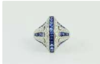
Lot n°45 Bague en or gris 18K (750/1000) de style art déco,...