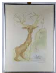
Lot n°389 DALI Salvador (1904-1989) : Le cerf se voyant dans...