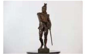
Lot n°121 Bronze d'un dragon dégainant son sabre du fourreau...