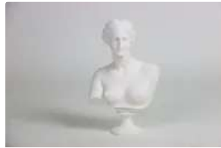
Lot n°214 - 2 Buste de la Vénus de Milo, statue en poudre de...