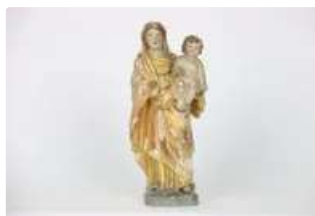
Lot n°172 Vierge à l'Enfant en bois sculpté polychromé et...