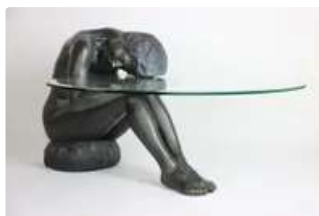
Lot n°381 Marc THOUY (XX), Table basse "Passion" figurant une...