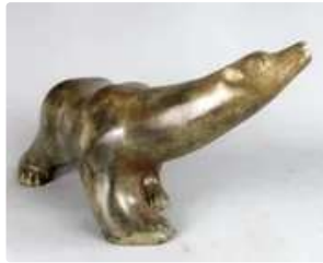
Lot n°101 Pierre Chenet (XXe siècle). Important bronze...