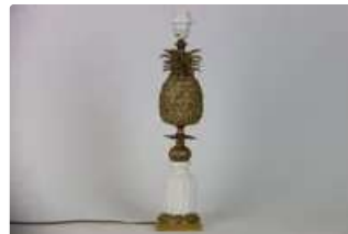
Lot n°286 Maison CHARLES (dans le goût de). Pied de lampe de... Est. : 100 - 200 €