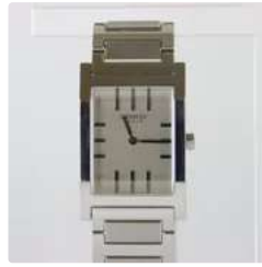
Lot n°26 HERMES. Bracelet-montre « Tandem », boîtier...