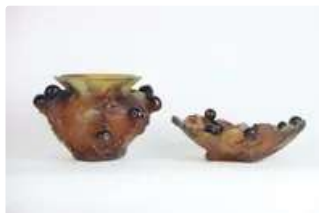
Lot n°224 DAUM France. Coupe et un vase collection figue en...