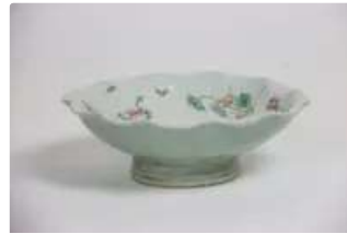
Lot n°436 CHINE. Coupe à bords chantournés sur piédouche en...