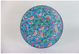
Lot n°139 EMAUX DE LONGWY. Plat en faïence fine à décor émaillé...