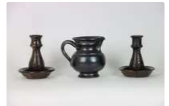
Lot n°287 JEAN MARAIS (1913/1998) Ensemble de céramiques... Est. : 100 - 150 €