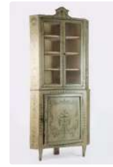
Lot n°214 Encoignure à deux corps, en bois laqué vert, la...