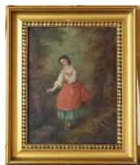
Lot n°427 - 3 L. ORIARD (XIXe siècle), La jeune fille au panier,...