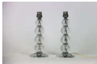
Lot n°305 Jacques ADNET (1900-1984) (dans le goût de). Paire...