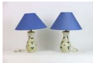
Lot n°423 - 7 Chine, début XXe siècle, Paire de vases de forme... Est. : 80 - 120 €