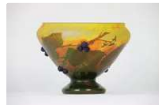
Lot n°226 DAUM NANCY (d'après). Vase verre gravé sur pied...