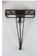
Lot n°256 Console en fer forgé avec plateau en marbre. A décor...