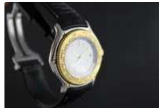
Lot n°78 EBEL Voyager Worldtime réf.9124913 Montre bracelet...