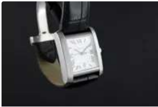
Lot n°72 CARTIER Tank Française réf.2564 Montre bracelet en...