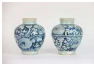
Lot n°432 - 4 Chine du Sud, XVIe XVIIe siècle, (pour export)....