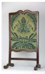
Lot n°178 Pare-feu ou écran de cheminée en bois naturel, soie...