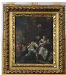
Lot n°155 École du XVIIIe siècle. Le sacrifice de la brebis....