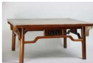
Lot n°432 CHINE. Période Guangxu. Table basse en bois d'orme...