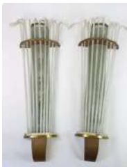
Lot n°258 Importante paire d'appliques murales en verre. De...