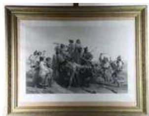
Lot n°430 Léopold ROBERT (1794-1835). Paire d'impressions...