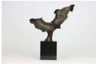
Lot n°129 - 3 GARGAILO (XXe siècle), Le baiser, sculpture en...