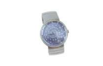
Lot n°79 Christian DIOR, Avenue Montaigne. Montre de dame en...