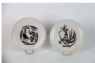
Lot n°314 Jean Lurçat (1892-1966) - Sant-Vicens. Paire...