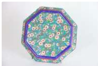
Lot n°136 EMAUX DE LONGWY. Dessous de plat en émaux...