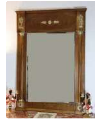
Lot n°201 Miroir. Miroir en acajou et placage d'acajou et...