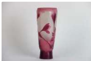
Lot n°228 GALLE - Nancy. Vase en verre multicouche Décor de...