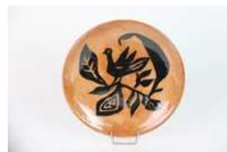
Lot n°313 - 1 Jean Lurçat (1892-1966). Assiette en céramique à...