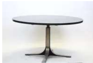
Lot n°325 Osvaldo BORSANI (1911-1985). Table circulaire en...