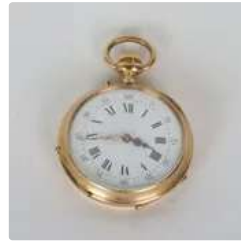
Lot n°86 Montre de gousset en Or 18K (750°/°). Les heures en...