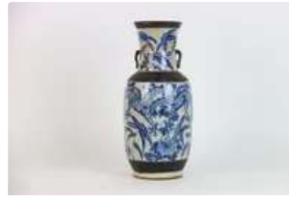
Lot n°433 - 1 CHINE. Vase Nankin blanc et bleu. Hauteur: 46 cm.