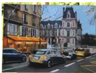
Lot n°382 JEAN MATROT (XXe). « Bistrot Marguerite». OEuvre...