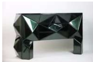
Lot n°361 Olivier De SCHRIJVER (né en 1958). École Belge. Une...