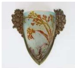
Lot n°229 Émile GALLE (1846 - 1904). Applique en verre...