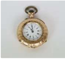
Lot n°84 Montre de gousset en Or 18K (750°/°). Les heures en...