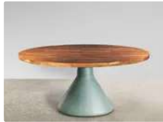
Lot n°320 - 2 Jorge ZALSZUPIN (1922-2020). Table de salle...