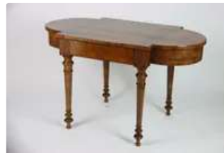
Lot n°208 Table à dessus de marquèterie de bois formant une...