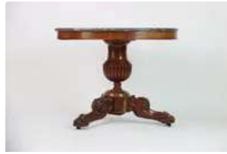
Lot n°212 Table en bois mouluré et sculpté à plateau de marbre...