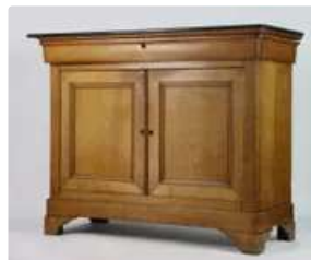
Lot n°209 Buffet bas ouvrant à deux portes, plateau en marbre...