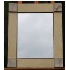
Lot n°261 Miroir en bois et plaques de marbres. Époque Art...