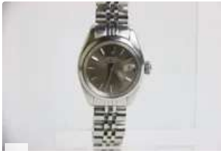
Lot n°68 ROLEX. Petite Oyster cadran "SIGMA ". Papier et boite.