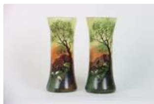
Lot n°240 François-Théodore LEGRAS (1839-1916). Paire de vase...