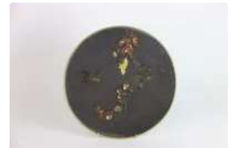
Lot n°439 JAPON. Période Meiji (1868 - 1912). Plat en fonte de...