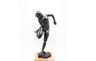
Lot n°126 - 1 Edgar DEGAS (1834-1917), d'après "Danseuse