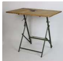
Lot n°290 Établissement SAUTEREAU, Table d'architecte en acier... Est. : 200 - 300 €