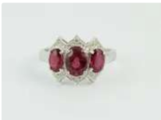
Lot n°36 Bague jarretière en or gris 18K (750/1000) centrée...