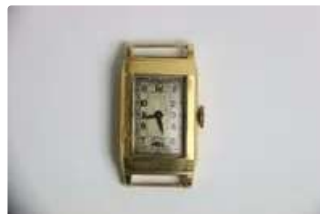
Lot n°81 POP Montre bracelet en or jaune 18k. Boitier...