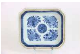
Lot n°432 - 2 Compagnie des Indes, XVIIIe siècle. Base d'une coupe...