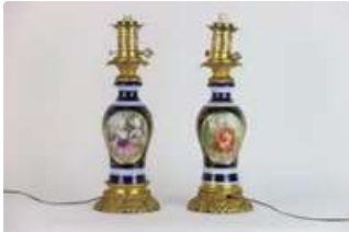
Lot n°215 BAYEUX. Paire de lampe à pétrole en porcelaine à...