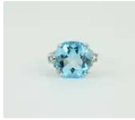
Lot n°42 Bague en or gris 18K (750/1000) ornée d'une topaze...