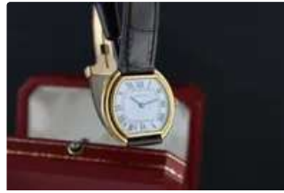
Lot n°69 CARTIER Ellipse réf. 7809 Montre bracelet en or...