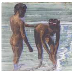
Lot n°238 MAJORELLE Jacques (1886-1962). (D'après). Femmes...