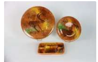
Lot n°303 Georges TARDIEU (XXe) à BIOT, réunion d'un plat...