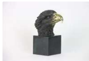
Lot n°112 Bronze à double patine, noire et or. "Tête d'Aigle"...