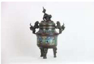
Lot n°440 Japon, XXème siècle. Brule parfum en émaux...