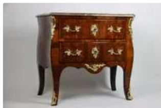
Lot n°176 Commode sauteuse en bois de placage ouvrant par deux...