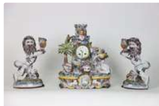
Lot n°219 SAINT-CLEMENT. Keller et Guérin. Période Emile...