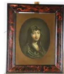
Lot n°154 École française fin XVII début XVIII. Femme drapée....