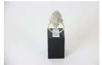
Lot n°35 Bague marquise en or blanc pavée de diamants taille...