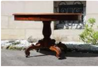
Lot n°211 Table ronde en bois verni à piètement tripode, style...