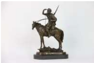
Lot n°92 Antoine-Louis BARYE (1795-1875). Important bronze...