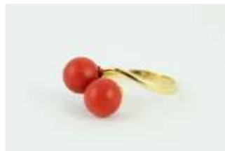
Lot n°52 Bague de type "toi et moi" en or jaune 18K (750/1000)...