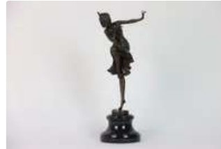
Lot n°122 Demeter H. CHIPARUS (1886-1947). "La Danseuse de...