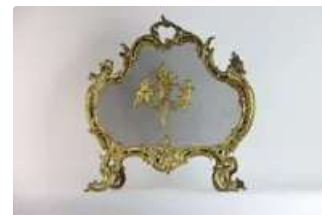
Lot n°180 Pare-feu en bronze doré et ciselé à décor rocaille...