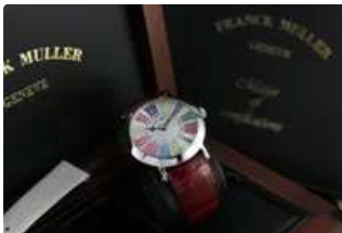
Lot n°76 FRANCK MULLER Round Color Dream Montre bracelet en...