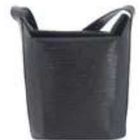
Lot n°65 - 1 LOUIS VUITTON. Sac à main type boîte en cuir épi...