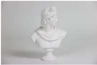
Lot n°214 - 1 Buste d'Apollon regardant vers la gauche, sculpture...