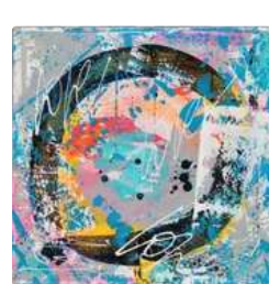
Lot n°387 Chantal-Béatrice LE BRETON, née en 1960....