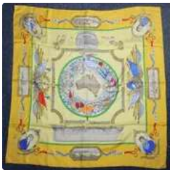
Lot n°32 HERMES, Foulard en soie à fond jaune, modèle...