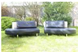
Lot n°380 STEINER, Canapé Mandala modulable en deux