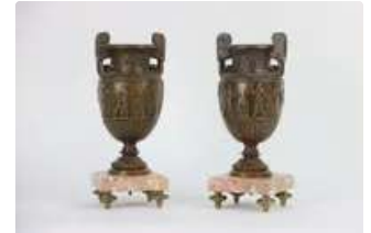
Lot n°217 Deux amphores en régule, décor à l'antique sur la...