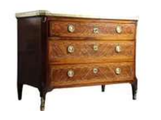
Lot n°182 Commode surmontée d'un marbre. Ouverture par trois...