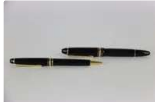
Lot n°64 MONT BLANC. Stylo plume en résine noire et métal...