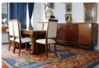
Lot n°242 Salle à manger MAJORELLE. Constitué d'une importante...