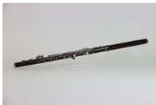
Lot n°223 Flûte en grenadille à perce conique, système Boehm,...