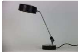
Lot n°298 Charlotte Perriand (1903-1999). Lampe de bureau Jumo...