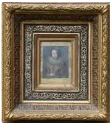
Lot n°147 École française du XVIIe. Portrait de femme de...