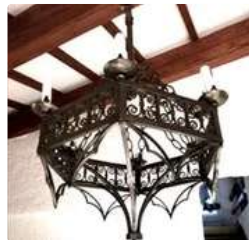
Lot n°259 Edgar William BRANDT (Paris 1880 - Genève 1960)...