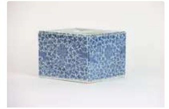
Lot n°433 - 2 Chine, début XXe siècle, Cache pot à section carrée...