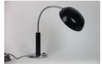
Lot n°295 Charlotte Perriand (1903-1999) (dans le goût). Lampe...