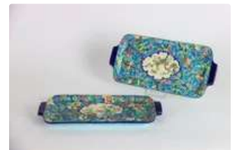
Lot n°138 EMAUX DE LONGWY. Réunion de deux plats à cake en...