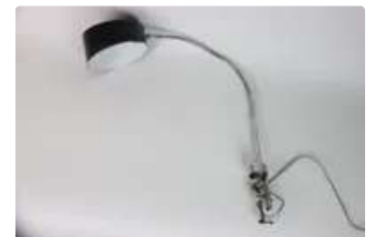
Lot n°276 Lampe JUMO en métal chromé noir, circa 1950, avec...