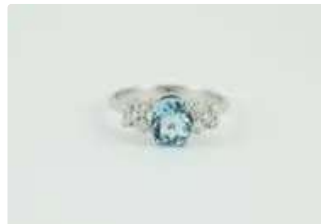
Lot n°49 Bague en or gris 18K (750/1000) centrée d'une...