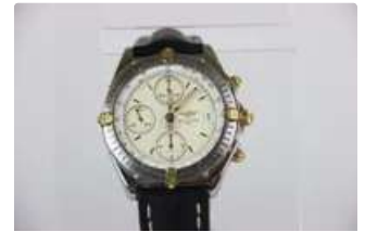
Lot n°75 BREITLING. Chronomat. Diam. 40mm. Ref. B13048....