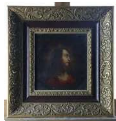
Lot n°148 École du XVIIème (dans le goût). Portrait du Christ...