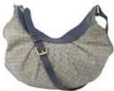
Lot n°65 - 2 LOUIS VUITTON. Sac porté épaule en cuir marine et...