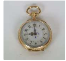
Lot n°87 Montre de gousset en Or 18K (750°/°). Les heures en...