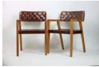
Lot n°348 Olivier De SCHRIJVER (né en 1958). École Belge. Deux...