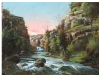
Lot n°170 Entourage de Gustave COURBET (1819-1877). "Le..."