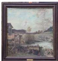
Lot n°171 Gustave COURBET (1819-1877) (École de). Le moulin à...