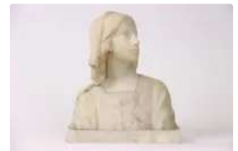
Lot n°220 - 2 Buste de Jeanne d'Arc en marbre et albâtre, socle en...