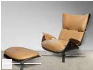
Lot n°320 - 1 Jorge ZALSZUPIN (1922-2020). Fauteuil dit «...