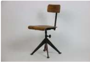
Lot n°317 Jean PROUVE (1901-1984). Chaise à dossier et fût...