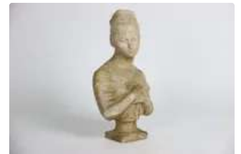
Lot n°208 - 1 JOSEPH CHINARD (1756-1813) (D'après).Buste de...