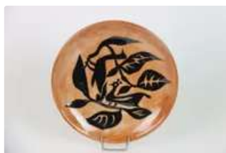
Lot n°313 - 4 Jean Lurçat (1892-1966). Assiette en céramique à...