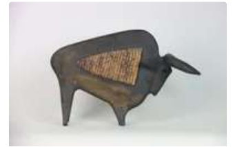
Lot n°338 Dominique POUCHAIN (né en 1956). Important sujet en...