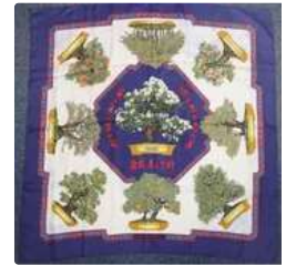
Lot n°31 HERMES, Foulard en soie, décor Bonsai. Dimensions :...