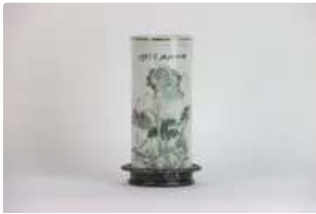
Lot n°434 CHINE, vers 1950, Vase cylindrique ou porte chapeau...