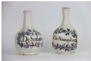
Lot n°131 NEVERS. Deux bouteilles à long col en faïence à...