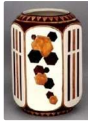
Lot n°251 Vase hexagonal en céramique craquelée, style Art...