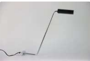
Lot n°376 Lampe de bureau en acier brossé, base à lest...