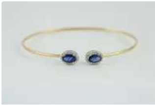
Lot n°59 Bracelet jonc en or gris 18K (750/1000) orné de...