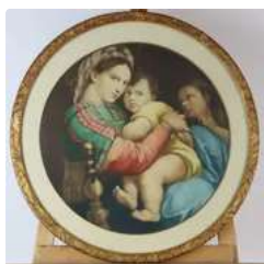
Lot n°163 RAPHAEL d'après, La Vierge à la chaise, lithographie...