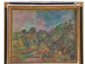
Lot n°421 Pinchus KREMEGNE (1890-1981). Paysage vallonné... Est. : 1 800 - 2 000 €