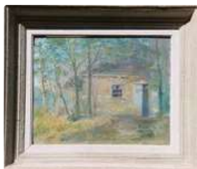
Lot n°235 MAJORELLE Louis (Toul, 1859-1926, Nancy). " Vue d'une...