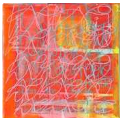
Lot n°388 Chantal-Béatrice LE BRETON, née en 1960. CRASH...