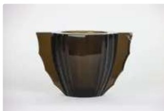
Lot n°247 DAUM Nancy. Vase à anses en verre fumé à pans coupés...