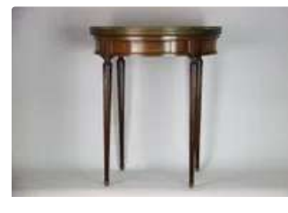
Lot n°184 Table bouillotte en bois surmontée d'un marbre beige...