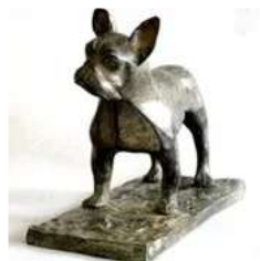
Lot n°97 Pierre Chenet (XXe siècle). Bronze animalier signé...