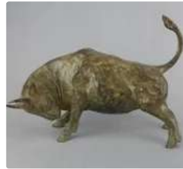
Lot n°102 Pierre Chenet (XXe siècle). Sculpture en bronze...