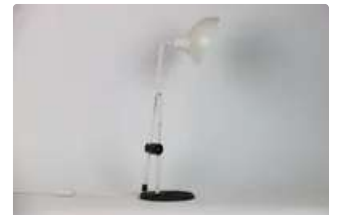
Lot n°375 Importante lampe de bureau en métal laqué blanc et...