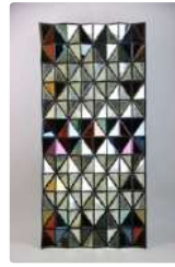
Lot n°366 Olivier De SCHRIJVER (né en 1958). École Belge. Un...