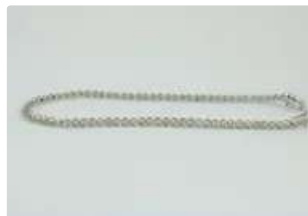
Lot n°53 Bracelet en or gris 18K (750/1000) souple composé...