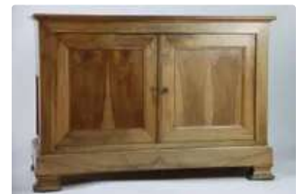
Lot n°210 Buffet bas Louis-Philippe en noyer ouvrant par deux...