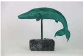
Lot n°110 Importante sculpture zoomorphe en bronze...