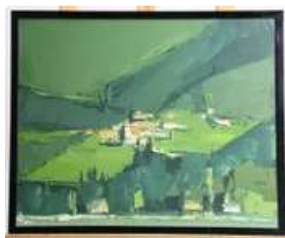
Lot n°384 Marcel DEMAGNY (1949). Paysage. Huile sur toile....