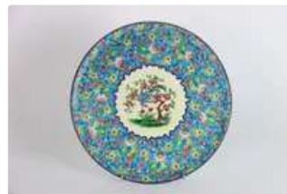
Lot n°137 EMAUX DE LONGWY. Plat en émaux cloisonnés. Décor...