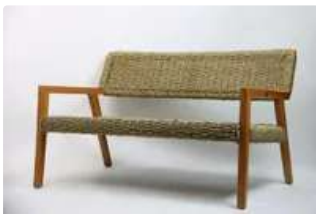
Lot n°343 Olivier De SCHRIJVER (né en 1958). École Belge. Un...