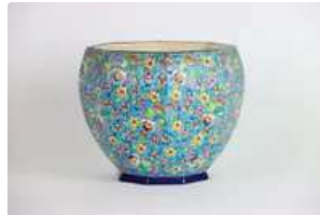
Lot n°140 EMAUX DE LONGWY. Cache-pot octogonale en émaux...