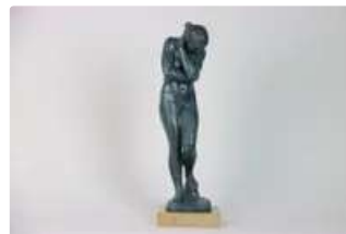
Lot n°126 Auguste RODIN (1840-1917). (D'après)."EVE". Grand...