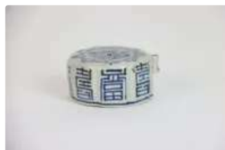
Lot n°432 - 3 Chine du Sud, XIXe siècle, Petit porte baguette à...