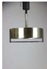
Lot n°377 Suspension "SPACE AGE" faite d'une succession de...