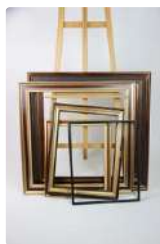
Lot n°222 - 1 Réunion de cinq cadres en bois doré, XXe siècle....