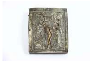
Lot n°145 RUSSIE. Icône en laiton argenté. Baptême du Christ....