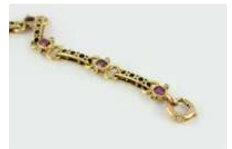
Lot n°54 Bracelet en or jaune 18K (750/1000) articulé composé...