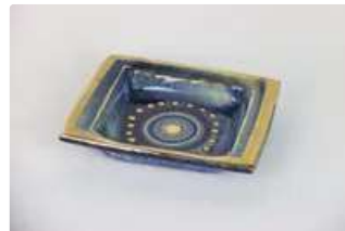
Lot n°302 Georges PELLETIER (né en 1938). Coupelle en...