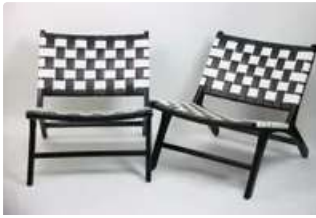
Lot n°347 Olivier De SCHRIJVER (né en 1958). École Belge. Deux...