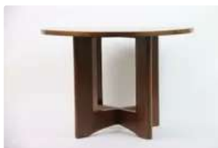
Lot n°243 Établissements Majorelle. ( Dans le gout) Table...