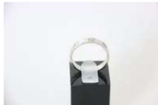
Lot n°33 CARTIER. Anneau love en or blanc. TDD : 56. On joint...