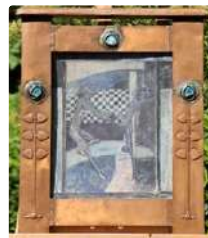
Lot n°264 École de Glasgow. Entourage de Charles Rennie...