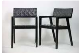
Lot n°349 Olivier De SCHRIJVER (né en 1958). École Belge. Deux...