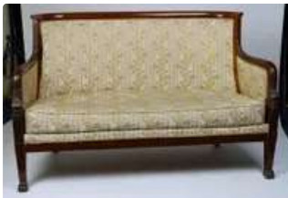
Lot n°206 Banquette en acajou plaqué avec accotoirs sculptés...