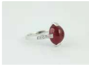
Lot n°50 Bague en or gris 18K (750/1000) centrée d'un...