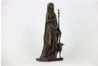
Lot n°121 - 1 Bronze à patine brune, sculpture représentant Jeanne...