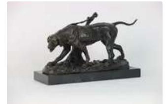
Lot n°91 Antoine-Louis BARYE (1795-1875). Sculpture...