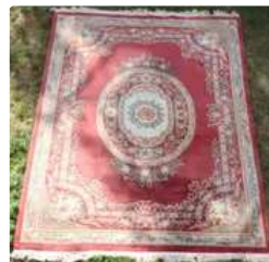
Lot n°442 Tapis Chine Tien Sin. Dimensions: 400 x 300 cm. ...