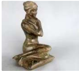
Lot n°105 Pierre Chenet (XXe siècle). Jeune femme nue assise...