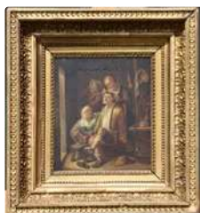
Lot n°160 École hollandaise du XVIIème. "Suture chez le..."