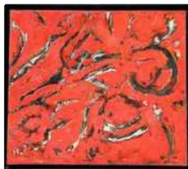
Lot n°386 École Russe du XXe. Composition. Signé en bas à...