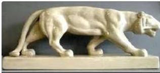
Lot n°254 Grand sujet en céramique beige représentant un tigre...