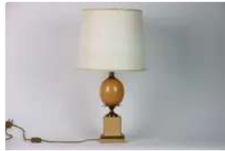
Lot n°369 Maison CHARLES. Importante lampe de table style...