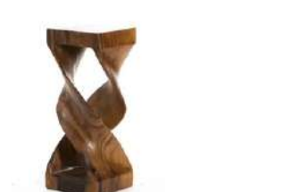
Lot n°358 Olivier De SCHRIJVER (né en 1958). École Belge. Un...