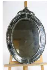
Lot n°204 Miroir vénitien en glace gravée de fleur et fronton...