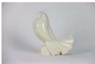
Lot n°308 Jacques ADNET (1900-1984).« Pigeon tête haute »...