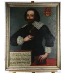
Lot n°146 École française du XVIIe siècle. Portrait de...