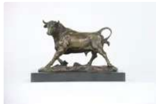
Lot n°93 Bronze animalier figurant un taureau, épreuve de la...