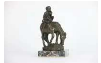
Lot n°95 Singe et cheval, bronze dans le goût du travail...