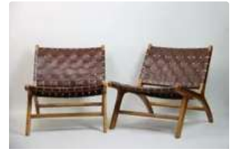
Lot n°350 Olivier De SCHRIJVER (né en 1958). École Belge. Deux...