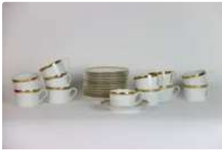
Lot n°143 HAVILAND. Partie de service de table en porcelaine...