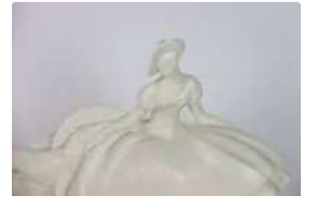
Lot n°253 LEJAN (XXème) : « La dame au lévrier ». Grand sujet...