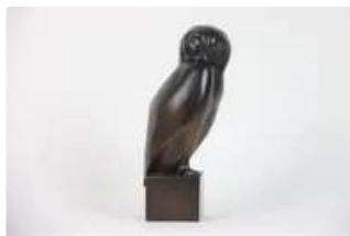
Lot n°108 - 1 POMPON François (1855-1933) (dans le goût), Jeune...