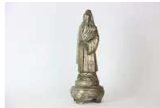
Lot n°438 ASIE, Statuette en métal, XXe siècle. Hauteur : 45 cm