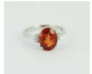
Lot n°51 Bague en or gris 18K (750/1000) centrée d'un grenat...