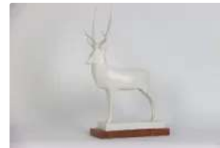
Lot n°109 François POMPON (1855-1933). (D'après) "Grand Cerf..."