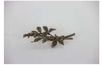
Lot n°58 Broche ornée de diamants entre 0.05 et 0.02ct. Poids...