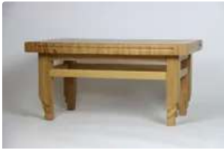
Lot n°292 Pierre CHAPO (1927-1987). (Dans le goût de). Table...