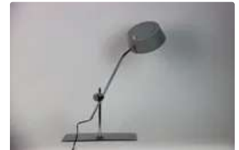
Lot n°299 Charlotte PERRIAND (1903-1999). Lampe flexible Jumo...