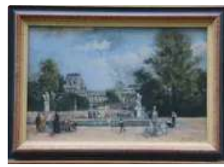
Lot n°169 École française du XIXe. "Le jardin du Luxembourg"....