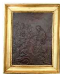
Lot n°152 École du XIXe siècle, Laissez venir à moi les...