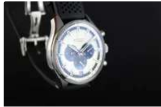
Lot n°73 ZENITH El Primero Chronomaster réf....