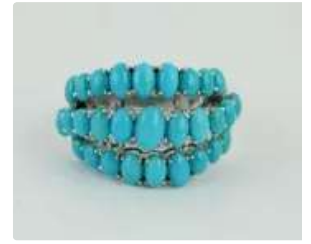
Lot n°43 Bague en or gris 18K (750/1000) ornée de trois...