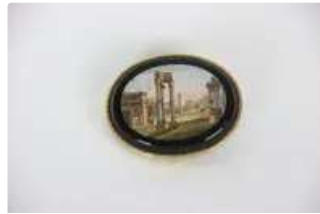
Lot n°60 Broche à décor de scène antique. Sur une monture en...