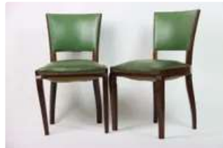
Lot n°255 Suite de six chaises en hêtre, assise et dossier en...