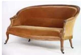
Lot n°207 Banquette en acajou portée sur deux pieds avant sur...