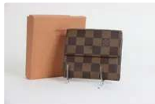
Lot n°67 Louis VUITTON, portefeuille modèle Brazza. Dans sa boîte.