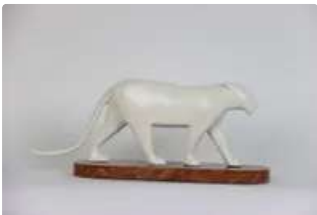
Lot n°108 François POMPON (1855-1933). (D'après) "Panthère..."