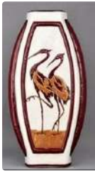
Lot n°250 Vase méplat de style art déco en céramique craquelée...