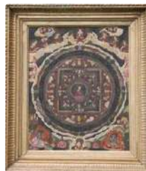
Lot n°441 Népal XXe siècle, École de Kaitmandu. Mandala à la...