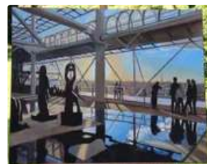
Lot n°383 JEAN MATROT (XXe). « Paris depuis Beaubourg». OEuvre...