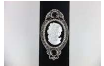
Lot n°62 Broche en argent (925/1000). Incrustations de...