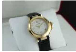
Lot n°70 CARTIER Pasha réf. 1035 Montre bracelet en or jaune...