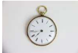
Lot n°90 Montre de gousset en Or 18K (750°/°). Chiffres...