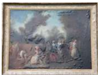
Lot n°164 Nicolas LANCRET (1690-1743). (Reproduction). L'Été...