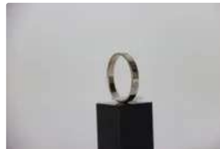
Lot n°34 CARTIER. Anneau Love en or blanc. TDD : 70 environ