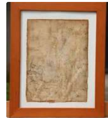
Lot n°150 École française dans le goût du XVIIe siècle, Christ...