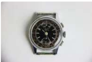
Lot n°80 ELES. Montre chronographe bracelet chromée. Boitier...