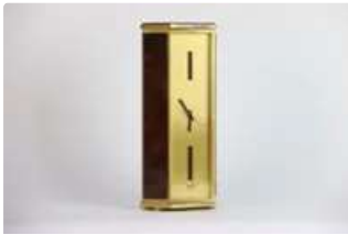
Lot n°29 HERMES Paris. Rare et importante pendule du bureau...