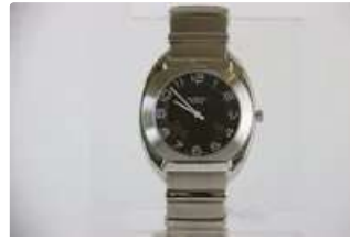
Lot n°27 HERMES. Modèle Espace. Montre bracelet de dame en...