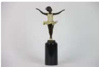
Lot n°124 Sculpture en bronze à deux patines reposant sur un...