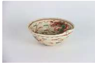
Lot n°435 Japon, période Meiji, (1868-1912). Coupe en faïence...