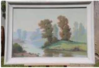
Lot n°412 RENE EMMANUEL (XX). "Paysage lacustre dans les Est. : 80 - 100 €