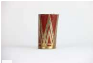
Lot n°271 Jean DUNAND (1877-1942). Manchette en laiton...