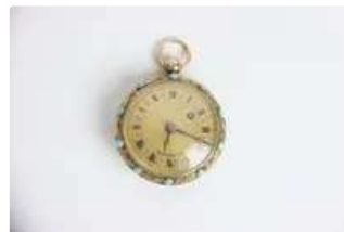
Lot n°82 Montre de gousset Or 18K (750°/°). Chiffres...