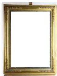
Lot n°221 Miroir biseauté en bois doré à décor de fleurettes...