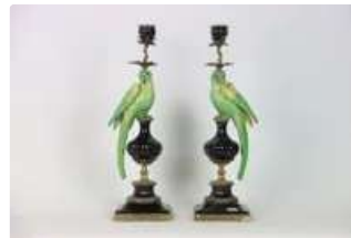
Lot n°133 Importante paire de candélabres en porcelaine...