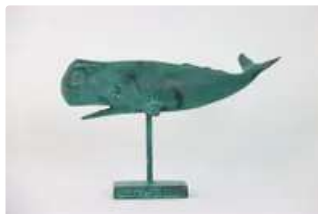
Lot n°111 Importante sculpture zoomorphe en bronze patinée...