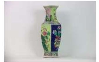
Lot n°436 - 1 CHINE. Vase en porcelaine hexagone chinois à décor...