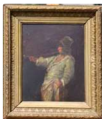
Lot n°161 École du XIXème. "Le fumeur de chibouque". Huile sur...