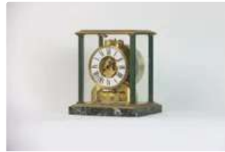
Lot n°30 - 1 Jaeger Lecoultre: pendule Athmos. Dans sa boîte...