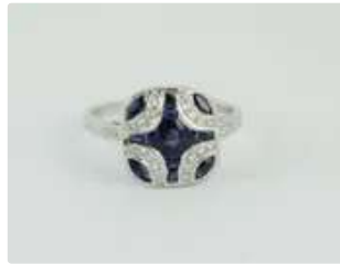
Lot n°46 Bague en or gris 18K (750/1000) de style art déco...