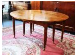
Lot n°209 - 1 Table ronde reposant sur huit pieds pouvant s'ouvrir...