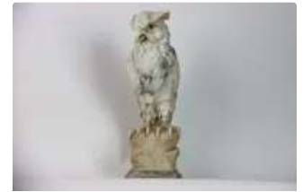
Lot n°214 - 4 Grand hibou en marbre jonché sur une pierre à deux...