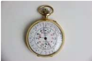
Lot n°88 J.AURICOSTE. Montre chronographe gousset en or jaune...