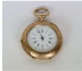
Lot n°89 Montre de gousset en Or 18K (750°/°). Les heures en...