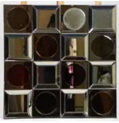
Lot n°364 Olivier De SCHRIJVER (né en 1958). École Belge. Un...