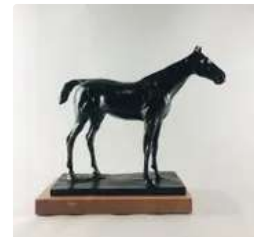
Lot n°109 - 1 Edgar DEGAS (1834-1917) (d'après), "Cheval à..."