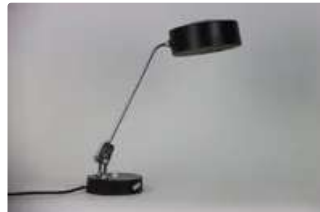
Lot n°297 Charlotte Perriand (1903-1999). Lampe de bureau...