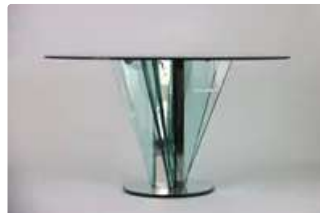
Lot n°301 GALLOTTI & RADICE, Table de salle à manger en verre...