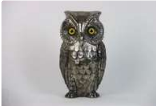
Lot n°339 Sceau à glaçon chromé argent, circa 1960, en forme...