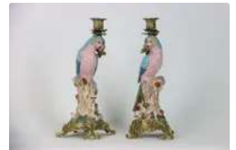
Lot n°134 Paire de bougeoirs en céramique craquelées et bronze...