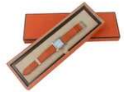
Lot n°28 HERMES. Modèle Heure H. Montre de dame en acier,...