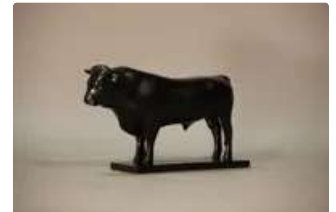
Lot n°107 François POMPON (1855-1933). (D'après). Sculpture en...