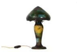
Lot n°232 Émile GALLE (1846 - 1904). Lampe Champignon. En...