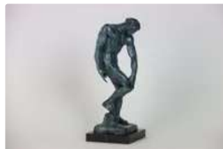
Lot n°125 Auguste RODIN (1840-1917). (D'après)," ADAM". Bronze...