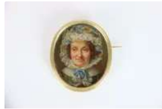
Lot n°61 Miniature à portrait de femme. Sur une monture en Or...