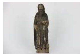
Lot n°173 Saint Antoine en chêne sculpté et polychromé. XVIIe...