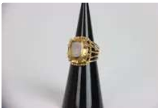
Lot n°51 - 1 Bague en or jaune 18K (750/1000) sertie d'une topaze....