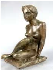
Lot n°104 Pierre Chenet (XXe siècle). Jeune femme nue assise...