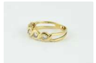
Lot n°39 Bague en or jaune 18K (750/1000) ornée de 5 diamants...