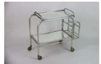
Lot n°307 Jacques ADNET (1900-1984). Table dessert à double...