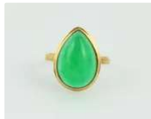
Lot n°38 Bague en or jaune 18K (750/1000) ornée d'un cabochon...