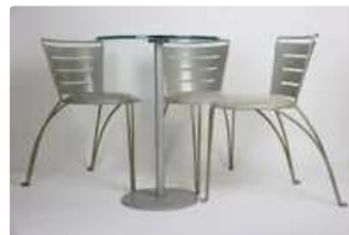
Lot n°378 Jean-Michel WILMOTTE (Né en 1948). « Jardin de la...