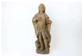
Lot n°179 - 1 Saint personnage en bois sculpté, dos ébauché...