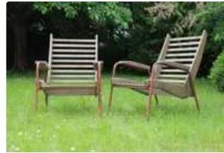
Lot n°319 Paire de fauteuils à lattes en bois et métal,...