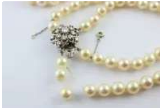
Lot n°55 Collier en perles de culture à deux rangs fermoir...