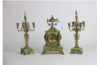
Lot n°215 - 2 Garniture de cheminée en marbre et ornements de...