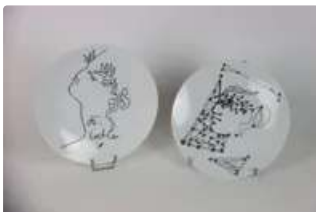
Lot n°288 Jean Cocteau (1889-1963). Paire d'assiettes à décor... Est. : 50 - 100 €