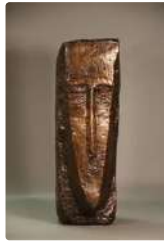
Lot n°128 Amadeo MODIGLIANI (1884-1920)....