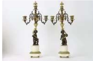
Lot n°215 - 1 Paire de candélabres en marbre blanc et bronze à...