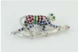
Lot n°63 Broche en or gris 18K (750/1000) dans le goût de...