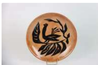
Lot n°313 - 6 Jean Lurçat (1892-1966). Assiette en céramique à...