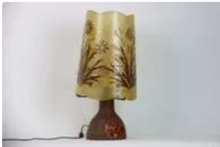
Lot n°280 - 1 Accolay (XXème). Céramique émaillée. Signée 'Accolay'... Est. : 200 - 300 €