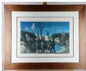
Lot n°390 DALI Salvador (1904-1989). Lithographie en couleurs,...