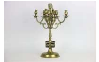
Lot n°205 Chandelier en bronze à huit feux en laiton d'un lion...