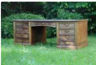
Lot n°273 - 1 MERCIER Frères, PARIS. Bureau américain à deux...