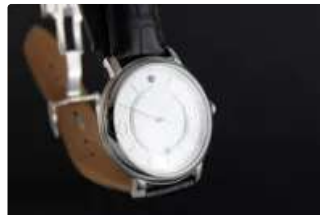
Lot n°77 BOUCHERON EPURE Montre bracelet en acier. Boitier...