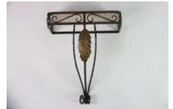
Lot n°257 Console en fer forgé avec plateau en marbre. Travail...