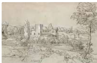
Lot n°156 École française du XVIIème siècle. Maison forte dans...