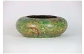
Lot n°142 BOUILLET Jean-Noël (né en 1943). Vasque en céramique...