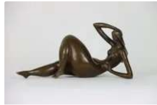
Lot n°120 Sculpture en bronze figurant une femme stylisée...