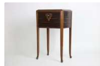
Lot n°241 Louis Majorelle (Toul, 1859-1926, Nancy). Table...