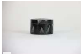
Lot n°272 Jean DUNAND (1877-1942). (Attribuée à). Boite...