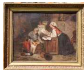
Lot n°162 École du XVIIIème. "Visite chez le dessinateur d'art..."