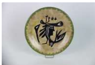
Lot n°313 Jean Lurçat (1892-1966) - Sant-Vicens. Assiette en...