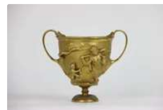
Lot n°245 Coupe en bronze ciselé et doré à décor de centaures...