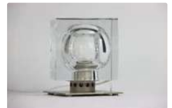
Lot n°331 Robert RIGO (né en 1929) pour BACCARAT, lampe de...