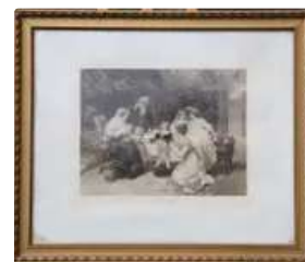
Lot n°429 FRED MORGAN (d'après). "La Première Culotte" et "La..."