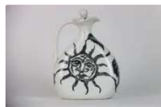
Lot n°316 Jean Lurçat (1892-1966) pour la manufacture...