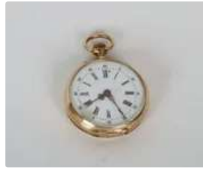
Lot n°85 Montre de gousset en Or 18K (750°/°). Les heures en...