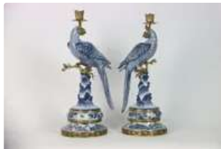
Lot n°132 Paire de bougeoirs en porcelaine craquelée à décor...