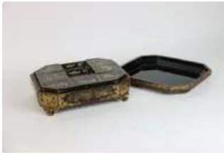
Lot n°432 - 6 CHINE. Boite à jeux en laque de canton Nankin....