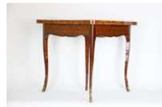
Lot n°177 Table à jeu en marqueterie de losanges de satiné et...